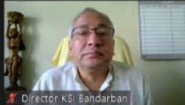
Director KSI Bandarban