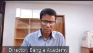
Director, Bangla Academy